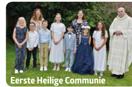
Eerste Heilige Communie in de Goede Herder

Stapt u de komende zomermaanden op de fiets dan is het de moeite waard om een rondje Zoeterwoude te fietsen. Dwars door de polders, over de oude kerkepaden, met de toren van de Sint Jan altijd in het zicht. De ontmoetingsruimte van de Sint Jan is dagelijks open om in de Mariakapel een kaarsje op te steken. Het intentieboek dat in de kapel ligt laat zien dat hier veelvuldig gebruik van gemaakt wordt. Mooi om te lezen dat passanten, parochianen en vakantiegangers hun zorgen en dankbaarheid bij Maria durven neerleggen. Ook aan de Hoge Rijndijk is het mogelijk om de kerk te bezoeken. Op de ochtenden dat het secretariaat bemenst is, staat de deur van de Goede Herderkerk gastvrij open en is het mogelijk om in de corridor een kaarsje op te steken bij Maria.